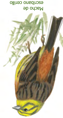
Machcho de escribano cenillo