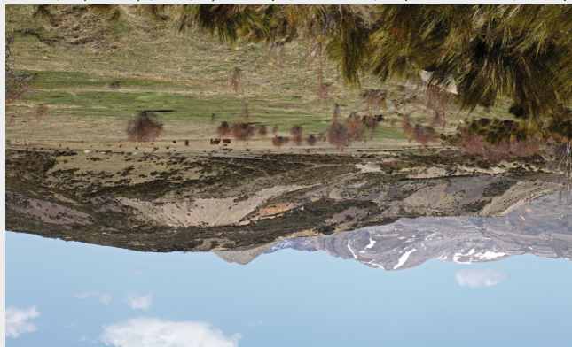
El ganado convive con los desmontes de la minería de carbón a cielo abierto en el Campo la Mora.

Casa del Parque Natural de Babia y Luna, Palacio de Quiñones. C/ Real s/n - 24143 Rioloago (León). Tfno. 987 687 554 - cp:bbaluna@pctrmonionatural.org