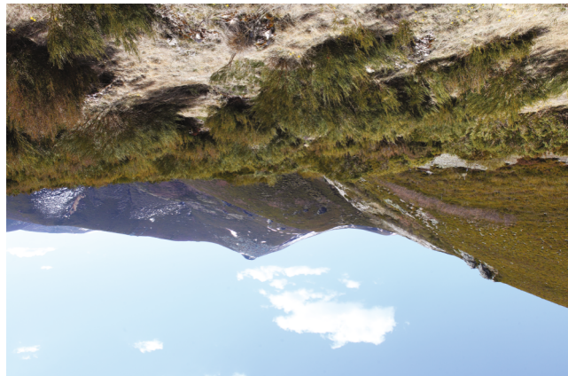
El collado de Villabandín sirve de paso entre Cabrillanes y Murias de

Continuando la ascensión, la ruta se desvía temporalmente por el vallejo lateral del arroyo de las Regadas para desembarcar en una bonita majada en la que se conserva un corral de piedra para las ovejas. Al otro lado de la pradera, la pendiente repunta al tiempo que se afronta el tramo final previo al Collado de Villabandín , donde el esfuerzo realizado se ve compensado por la panorámica del valle de Valmayor que tantas veces recorrieron los rebaños trashumantes. Tras el merecido descanso, será preciso retornar a Quintanilla de Babia por el mismo trazado.