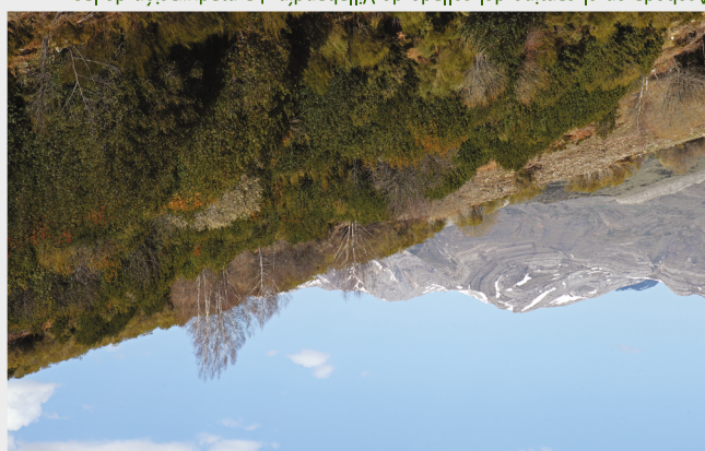
Acebeda en el camino del collado de Villabandín. La maduración de las drupas (frutos) del acebo durante el invierno atrae bandadas de zorzales y palomas torcaes.